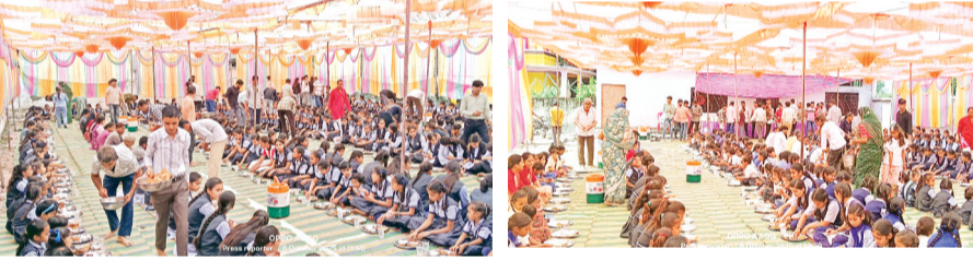
हरिभूमि न्यूज़ | कानड़

शारदीय नवरात्रि के समापन पर सोमवार को कन्याभोज का आयोजन हुआ। मां बिजासन मित्र मंडल द्वारा प्रतिवर्ष अनुसार इस वर्ष भी नवरात्रि पर्व के समापन पर मां बिजासन माता मंदिर के पास स्थित मांगलिक भवन में सोमवार को कन्या भोज का आयोजन किया गया, जिसमें बड़ी संख्या में नगर की कन्याओं ने भोजन प्रसादी ग्रहण की। मंडल द्वारा आयोजित कन्याभोज में