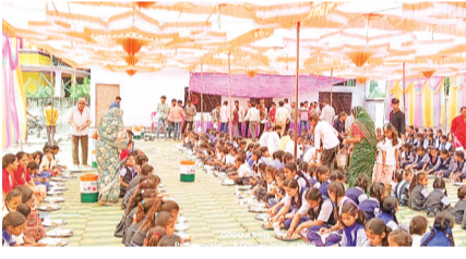
हरिभूमि न्यूज़ | कानड़

शारदीय नवरात्रि के समापन पर सोमवार को कन्याभोज का आयोजन हुआ। मां बिजासन मित्र मंडल द्वारा प्रतिवर्ष अनुसार इस वर्ष भी नवरात्रि पर्व के समापन पर मां बिजासन माता मंदिर के पास स्थित मांगलिक भवन में सोमवार को कन्या भोज का आयोजन किया गया, जिसमें बड़ी संख्या में नगर की कन्याओं ने भोजन प्रसादी ग्रहण की। मंडल द्वारा आयोजित कन्याभोज में