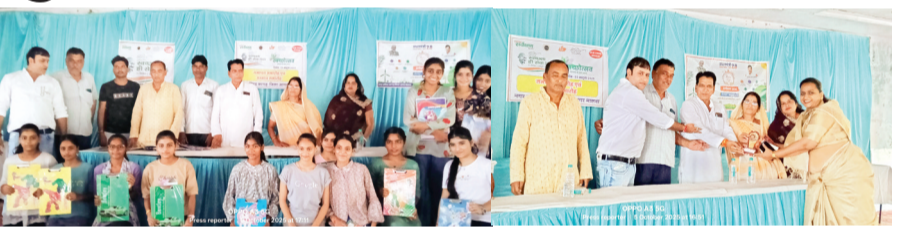
हरिभूमि न्यूज़ | कानड़

नगर परिषद और मां बिजासन महिला मंडल द्वारा नवरात्रि के पहले दिन से ही सरस्वती शिशु मंदिर ग्राउंड में पांडाल सजाकर गरबा महोत्सव का आयोजन किया गया था जिसमें नगर की बालिकाओं ने बढ़ चढ़कर हिस्सा लिया। साथ ही परंपरागत वेशभूषा में बालिकाओं ने मनमोहक गरबा प्रस्तुति दी। सात दिवसीय गरबा महोत्सव में अपनी प्रतिभा से आयोजन को सफल बनाने वाली