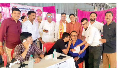
हरिभूमि न्यूज़ | कानड़

शिविर में जनरल फिजिशियन जनरल सज्जनमहिल व प्रसूति विशेषज्ञ हृदय एवं जोड़ प्रत्यारोपण विशेषज्ञ शिशु रोग मेरु रोग रज रोग नाक कान गला रोग दंत रोग विशेषज्ञ सहित कैंसर व बांझपन रोग के विशेषज्ञ चिकित्सक उपस्थित रहे। जिनके द्वारा 115 मरीजों का निष्कल उपचार किया गया। इसके साथ ही 7 मरीजों का निष्कल ऑपरेशन अथवा निष्कल उचित उपचार हेतु उच्चतम चिकित्सालय ले जाया गया।